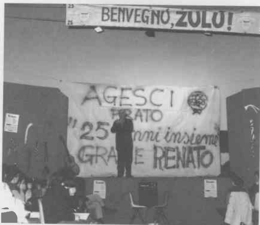
Un momento della festa per i 25 anni di sacerdozio.