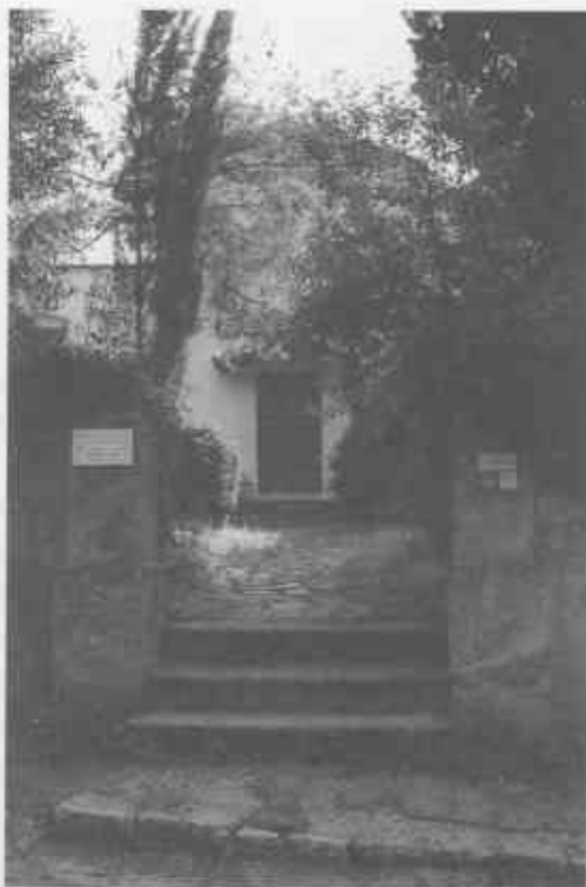
La chiesa di S. Michele, a Canneto